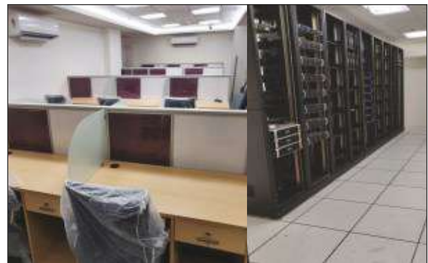
Supply Installation Testing and commissioning of different items Equipment System installed at Electronic Media Monitoring Centre (EMMC) at 10th Floor Soochna Bhawan New Delhi.