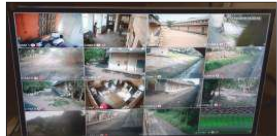
Supply, Installation, Testing, Commissioning and Maintenance of CCTV surveillance system at 254 (Two hundred and fifty-four) warehouses of Central Warehousing Corporation, across pan India.