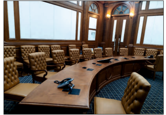
विदेश मंत्रालय, साउथ ब्लॉक नई दिल्ली के उन्नत संचार उपकरण वाले सम्मेलन कक्ष का नवीनीकरण