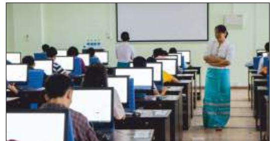
Supply, Installation, Testing, Commissioning and Onsite support for classroom equipment for Myanmar Institute of Information Technology at Mandalay, Myanmar.