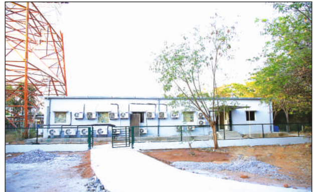
एफ. एम. फेज-III