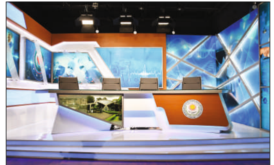
जिपमेर, पांडिचेरी के लिए एचडी टीवी स्टूडियो, आईआर स्टूडियो और डिजिटल साइनेज सिस्टम की स्थापना