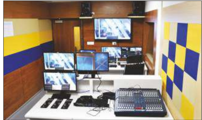
Production Control Room