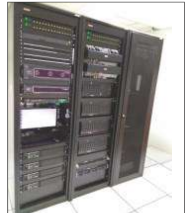
Supply, Installation, Testing and Commissioning of Studio Broadcast Equipments along with Infrastructure works for Visva-Bharati