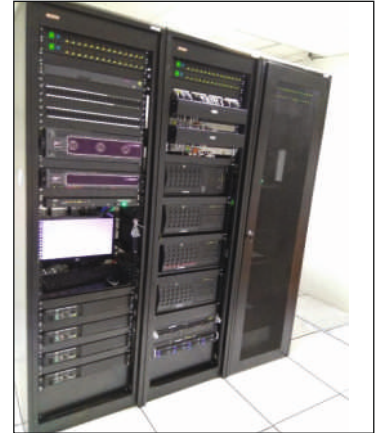
विश्व-भारती के लिए अवसंरचना कार्यों सहित स्टूडियो प्रसारण उपकरणों की आपूर्ति, स्थापना, परीक्षण और चालू करना