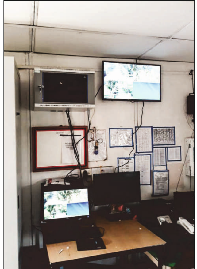
पूर्वी कमान के तहत विभिन्न सैन्य स्टेशनों के लिए सीसीटीवी समाधानों की खरीद और स्थापना

बेसिल परामर्श एजेंसी, प्रणाली समेकक के साथ ही प्रसारण इंजीनियरिंग और सूचना एवं संचार प्रौद्योगिकी के क्षेत्र में एक टर्नकी समाधान प्रदाता के रूप में कार्य करता है।