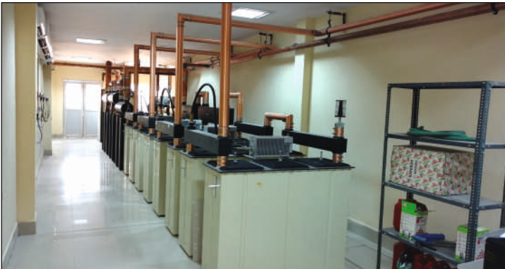
एफ. एम. फेज-III

इलेक्ट्रॉनिक मीडिया निगरानी केंद्र, 10वीं मंजिल सूचना भवन, नई दिल्ली में आपूर्ति, स्थापना, परीक्षण को स्थापित उपकरण प्रणाली के विभिन्न मदों को चालू करना