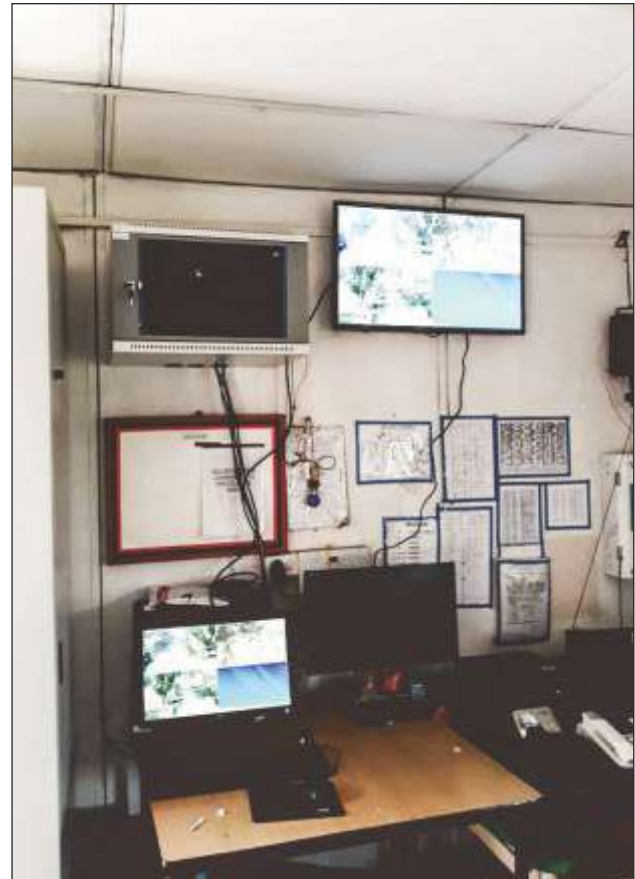
Procurement and Installation of CCTV Solutions for various military stations under Eastern Command

BECIL works as consultancy agency, system integrator as well as a turnkey solution provider in the fields of Broadcast Engineering and Information & Communication Technology.