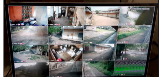
भारत भर में केंद्रीय भंडारण निगम के 254 (दो सौ चौवन) गोदामों पर सीसीटीवी निगरानी प्रणाली की आपूर्ति, स्थापना, परीक्षण, चालू करना और रखरखाव