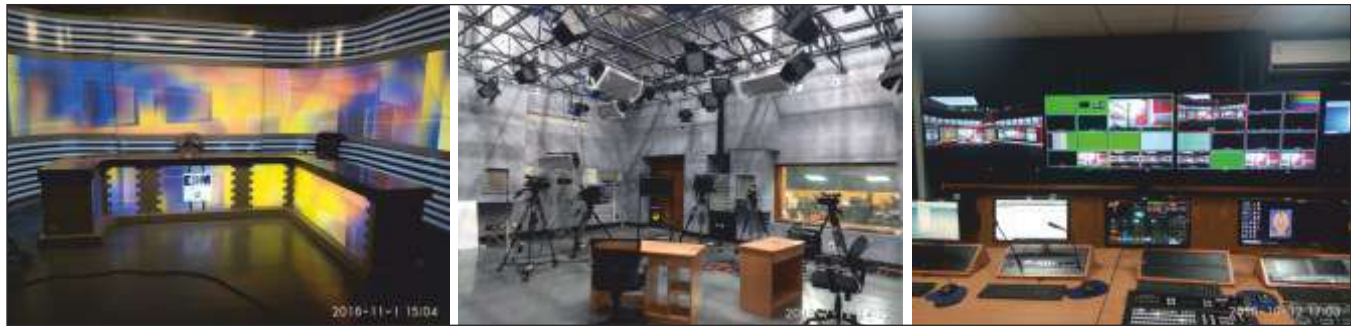
Supply, Installation, Testing and Commissioning of TV Studio Setup for SRFTI.

Supply, Installation, Testing, Commissioning and Maintenance of CCTV surveillance system at 254 (Two hundred and fifty-four) warehouses of Central Warehousing Corporation, across pan India