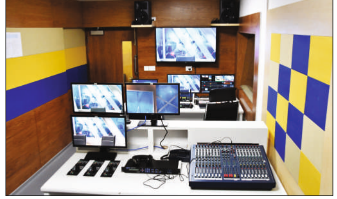
निर्माण नियंत्रण कक्ष