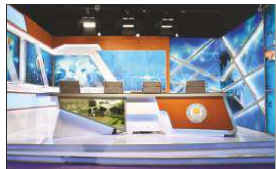
Setting up of HD TV studio, IR studio and Digital Signage systems for JIPMER, Pondicherry