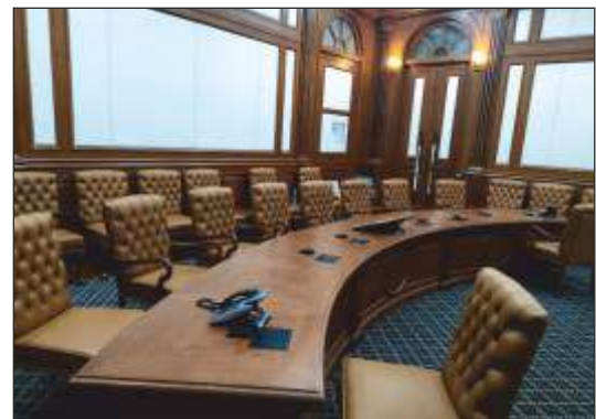
Renovation of Conference room with advanced communication equipment MEA South Block New Delhi.