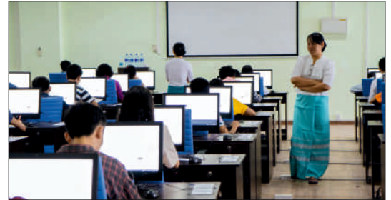
म्यांमार सूचना प्रौद्योगिकी संस्थान, मंडाला, म्यांमार के लिए कक्षा उपकरण की आपूर्ति, स्थापना, परीक्षण, चालू करना और ऑनसाइट सहयोग